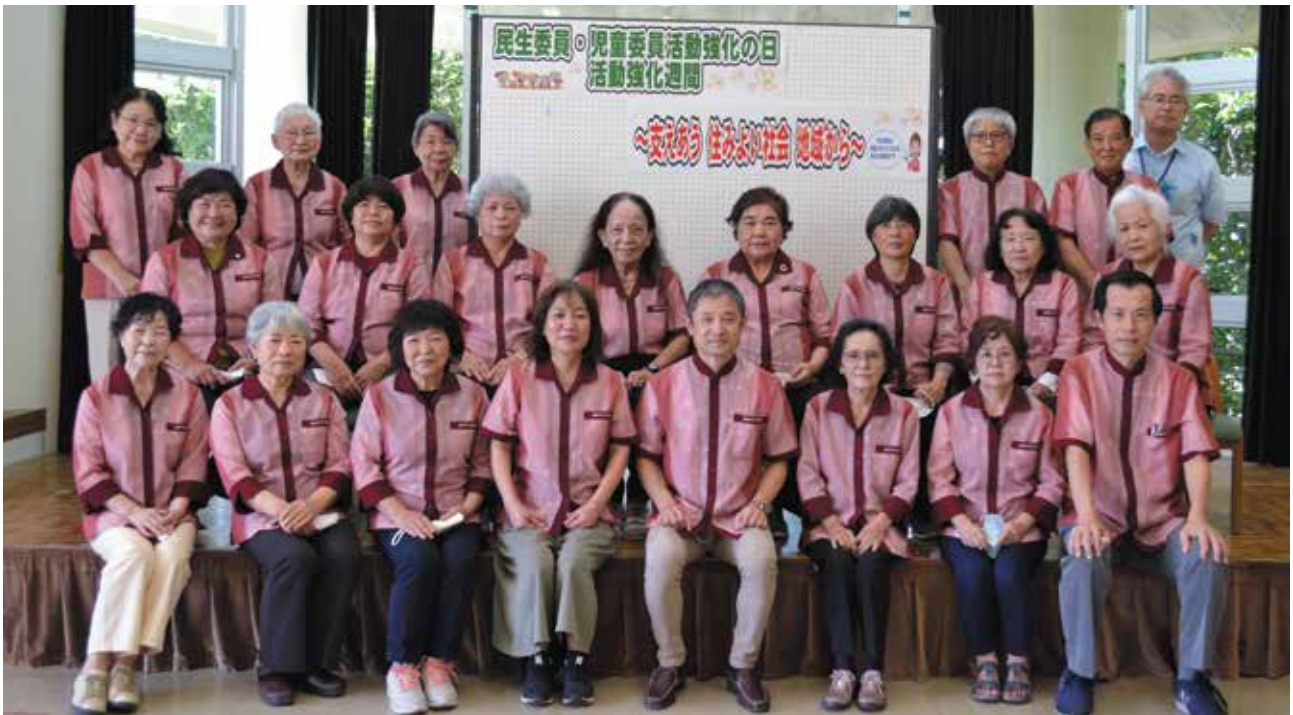
▲金武町民生委員・児童委員のみなさん

金武町には、25名の民生委員・児童委員がいます。そのうち2名は子どもや子育てに関する支援を専門に担当する主任児童委員です。ひとりで悩まずに相談してください。