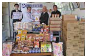
▲ ろうきん様、金武町役場職員労働組合様