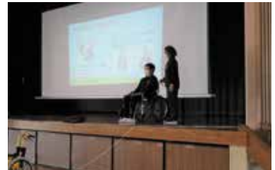
▲車いすの使い方を説明

2月25日(金)に、金武小学校4年生が福祉教育を行い本会職員と一緒にふだんのくらしのしあわせ、こころのバリアフリーについて知ってもらいました。「ふくしについて」の講話の後、車いす体験とアイマスク体験をしました。体験をとおして、相手の立場に立って考えることの大切さを実感していました。