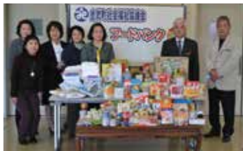
▲ 公益財団法人 北部法人会女性部会様