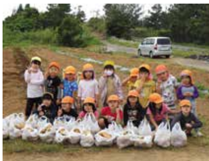
認定こども園きのほし

11月にふれあい農園で植え付けしたジャガイモを2月28日～3月14日の期間に町内の11園の子ども達が収穫しました。大きく育ったジャガイモに大興奮で収穫を楽しみました。収穫したじゃがいもは各園に持ち帰り、カレーを作っておいしくいただきました。