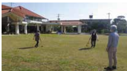
▲ グラウンドを楽しむ方も