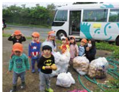
らくる屋嘉小規模保育園