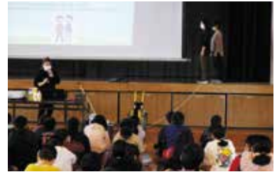
▲アイマスクの誘導方法を説明