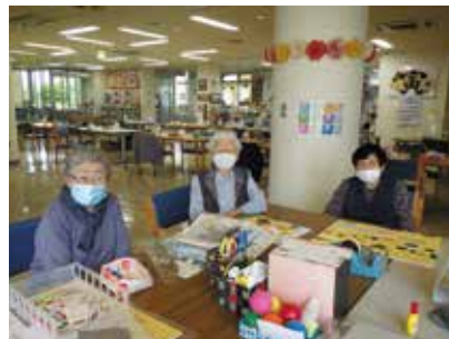
手芸やレクを楽しんでいます