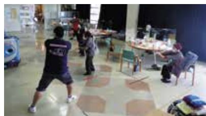
▲ 「北国の春」の曲で体操を行う参加者