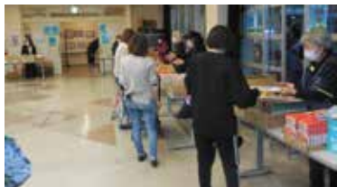
▲食品コーナーで配布をする民生委員さん