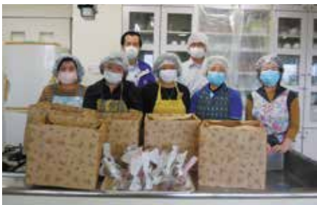
▲マフィン作りに参加した民生委員さん