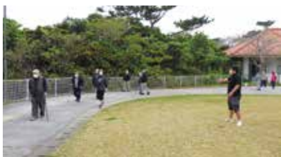
▲ 職員に励まされ福祉センターの広場周辺を散歩

まん延防止等重点措置期間中、本会の高齢者事業も休止となりましたが、高齢者の皆さんの社会活動自粛中も趣味活動の支援をしたいと、「めーばるゆんたく広場」を実施しました。短時間ですが、参加者は手芸、大正琴、散歩、体操、ゲームなどを楽しみました。