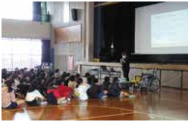
▲ふくしについての説明