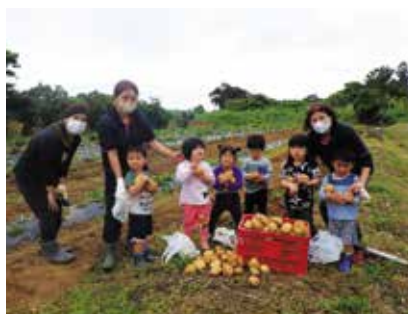
金武こどもみらい園